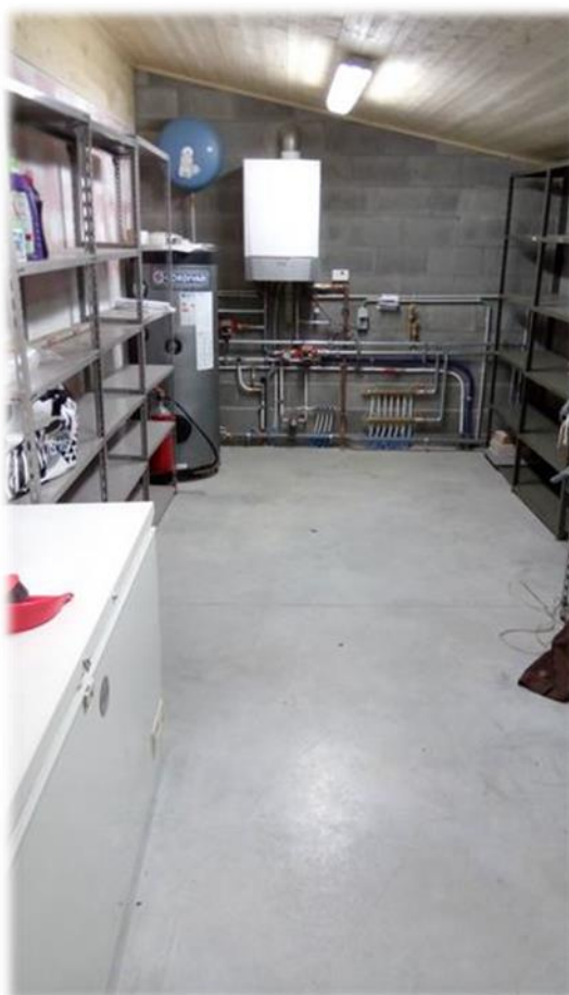
Local de rangement